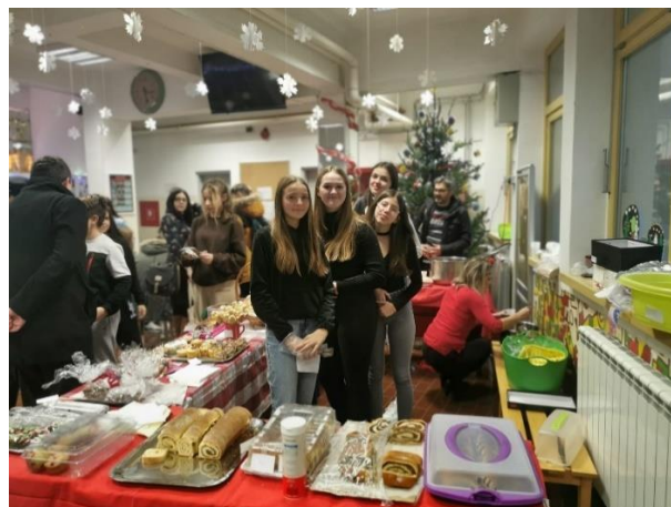
Slika: prostor za okrpju tijekom Božićnog sajma