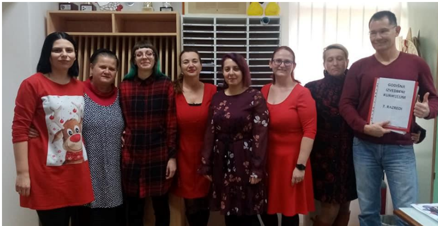
Slika: nastavnici prilikom obilježavanja Dana crvenih haljina

3. veljače naši su nastavnici obilježili Dan crvenih haljina kojim se želi podići svijest o moždanom udaru kod žena, te potaknuti žene na brigu o svom zdravlju, a posebno o zdravlju srca i krvnih žila.