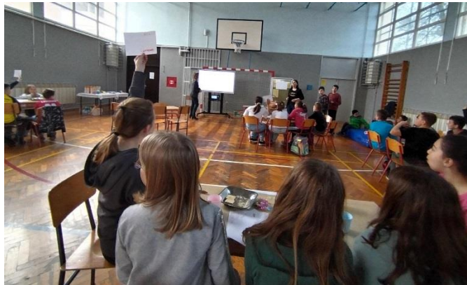
Slika: pub kviz za učenike razredne nastave