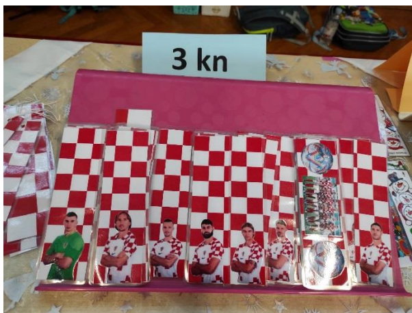
Slike: Učenički radovi na štandovima