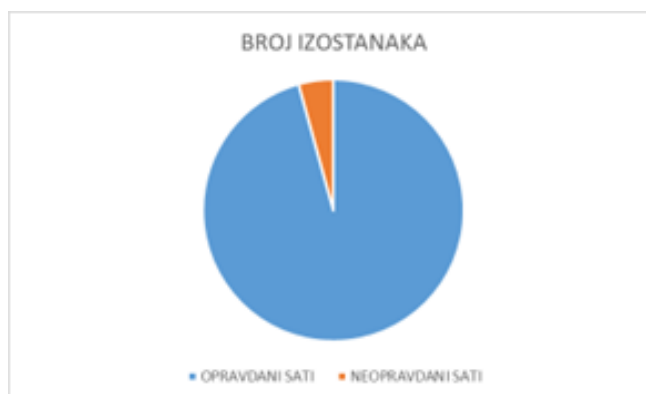
Graf 1. Ukupan broj opravdanih i neopravdanih izostanaka