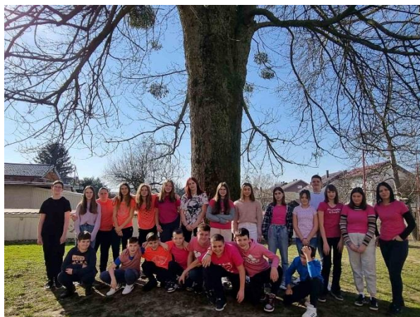
Slike: Učenici 6.a i 7.c prilikom obilježavanja Dana ružičastih majica

Dan planeta Zemlje obilježava se 22. travnja kako bi se jačala svijest ljudi prema prirodnom okolišu. Različitim događanjima i akcijama nastoji se skrenuti pozornost ljudi na opasnost koja prijete životu na Zemlji zbog porasta globalnog onečišćenja te ih potaknuti da osvijeste problem zagađenja okoliša. Učenici su obilježili Dan planeta Zemlje prigodnim plakatima i porukama.