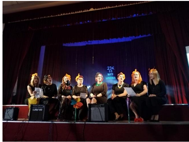
Slike: učenici i učiteljice prilikom obilježavanja 234. Dana škole

Kroz razne aktivnosti i projekte tijekom školske godine surađujemo smo s Razvojnog agencijom MRAV, Udrugom osoba s invaliditetom OSI, Društvom NAŠA DJECA, Muzejom Moslavina, Turističkom zajednicom - s kojima kao škola-partner sudjelujemo i realiziramo različite razvojne, preventivne, edukativne i kulturno-umjetničke projekte.