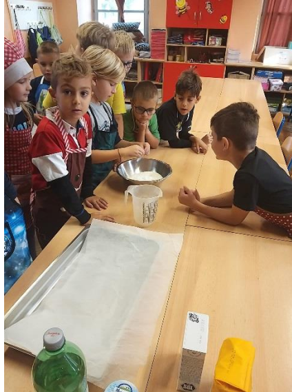
Slika: učenici u produženom boravku prilikom obilježavanja Dana kruha i zahvalnosti za plodove zemlje

Program produženog boravka provodi se od 2016./2017. školske godine uz suglasnost osnivača Grada Kutine. U programu u jednoj odgojno-obrazovnoj skupini u vrijeme su nakon popuštanja epidemioloških mjera sudjelovali učenici razredne nastave, I. i II. razreda. Uz pedagoški pristup učiteljice Josipe Pavlović Mlakar – učenici su uspješno savladavali sve školske obveze, a također su se kao skupina uključili u sve aktivnosti na nivou škole. Uz obilje kreativnog rada i raznovrsne aktivnosti kvalitetno su provodili vrijeme uz dosta radosti i zabave.